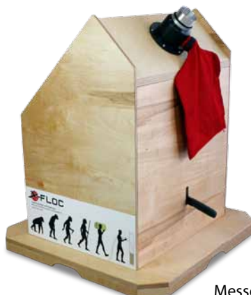
Messemodell von hinten