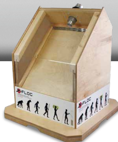
Messemodell EM3XX und Zellofant M95