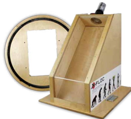
Messemodell kompakt mit Adapterplatte für den Zellofant M95