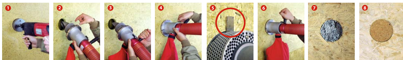
1 Сверление приточного отверстия при помощи цилиндрической пилы