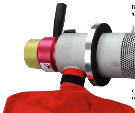
Вентилируемая вращающаяся головка J-Jet 75>60

Категория 04 | Сопла и комплектующие для выдувного оборудования