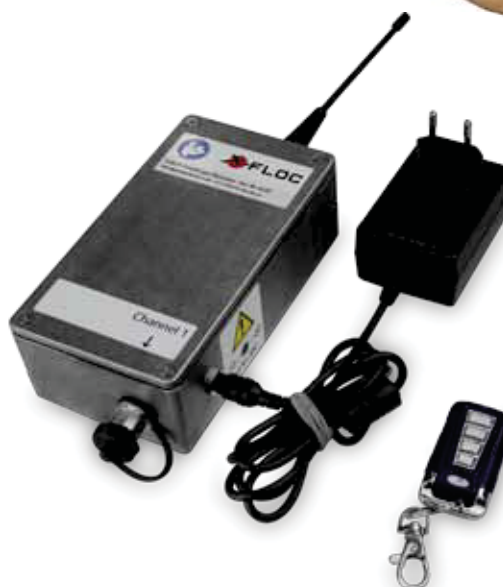
Funkfernsteuerung FFB22 unidirektional Art.-Nr. 8229