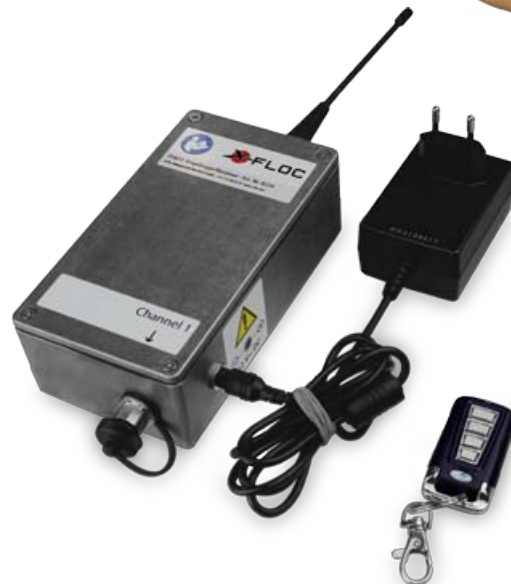
Funkfernsteuerung FFB22 unidirektional Art.-Nr. 8229